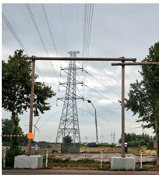
Installatie van twee houten portieken onder een luchtlijn.

Elia is verantwoordelijk voor het beheer, het onderhoud en de uitbouw van het Belgische hoogspanningsnet. Tijdens werkzaamheden aan de bovengrondse luchtlijnen plaatst Elia, indien nodig, beschermportieken onder de elektriciteitsdraden. De beschermportieken bestaan uit minstens twee met elkaar verbonden palen die obstakels onder de luchtlijn beschermen.