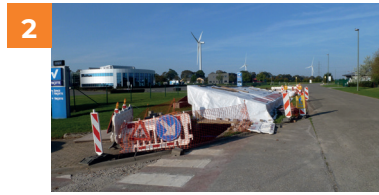
2 De mofput van een 70kV-kabel.

De kabeldelen worden in de sleuven geplaatst of door de wachtbuizen getrokken.