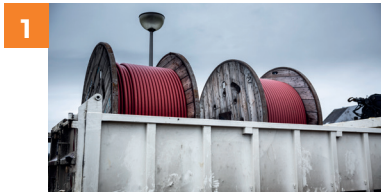
1 Het transport van de kabels gebeurt op bobijnen.

De kabels worden op bobijnen getransporteerd en naar de werfzone gebracht. Het aantal meter dat op één bobijn kan worden gerold is beperkt.