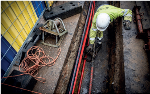
Aanleg 36kV-verbinding door een woonwijk.