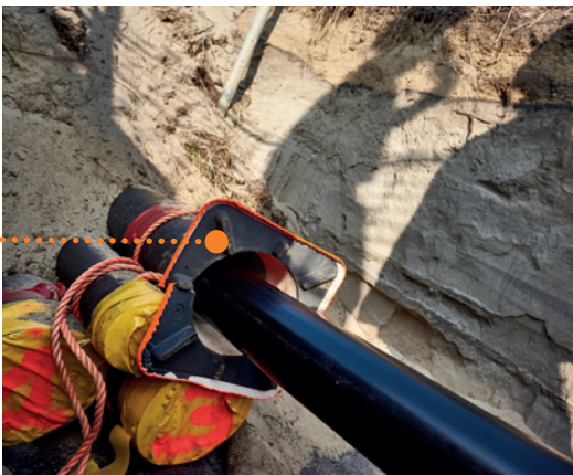
Wachtbuizen voor een dubbele 150kV-verbinding.