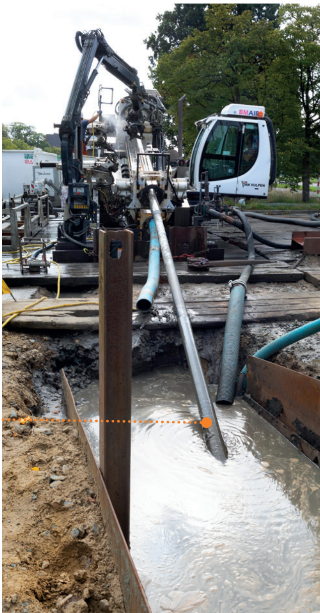
Gestuurde boring bij een 150kV-kabel.

Indien mogelijk wordt deze techniek toegepast om drukke kruispunten, spoorwegen of natuurgebieden te kruisen. Of op plaatsen waar een open sleuf een te grote impact heeft op de omgeving.