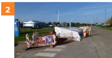
De mofput van een 70kV-kabel.

De kabeldelen worden in de sleuven geplaatst of door de wachtbuizen getrokken.