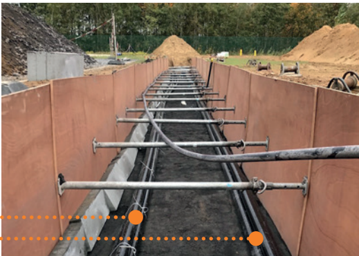
Aanleg dubbele 150kV-verbinding .