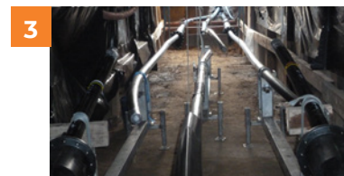
Binnen in de mofput van een 70kV-kabel.

Op de plaatst waar de kabels met elkaar worden verbonden, kan Elia een inspectiekast plaatsen. Deze kast laat toe om regelmatig controles uit te voeren op de kabels.