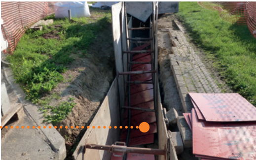
Aanleg 70kV-verbinding na plaatsing beschermingsplaten en waarschuwingslint.