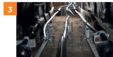
3 Binnen in de mofput van een 70kV-kabel.

Op de plaatst waar de kabels met elkaar worden verbonden, kan Elia een inspectiekast plaatsen. Deze kast laat toe om regelmatig controles uit te voeren op de kabels.