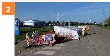
2 De mofput van een 70kV-kabel.

De kabeldelen worden in de sleuven geplaatst of door de wachtbuizen getrokken.