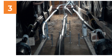
3 Binnen in de mofput van een 70kV-kabel.

Op de plaatst waar de kabels met elkaar worden verbonden, kan Elia een inspectiekast plaatsen. Deze kast laat toe om regelmatig controles uit te voeren op de kabels.