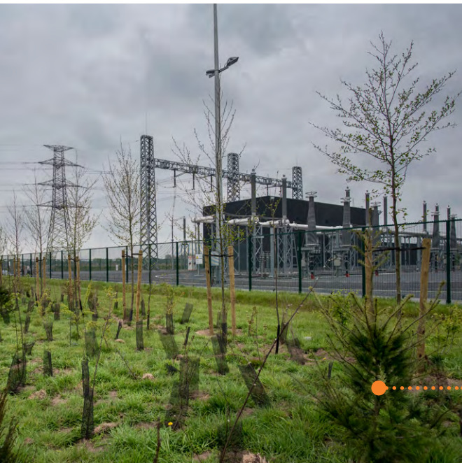
Voorbeeld van aanplanting groenscherm bij een nieuw hoogspanningsstation.

In deze fiche vindt u informatie over de maatregelen die Elia neemt om de impact op de natuur en het landschap te beperken. Heeft u nog vragen? Aarzel niet om contact op te nemen met een medewerker van Elia via omwonenden@elia.be of 0800 11 089.