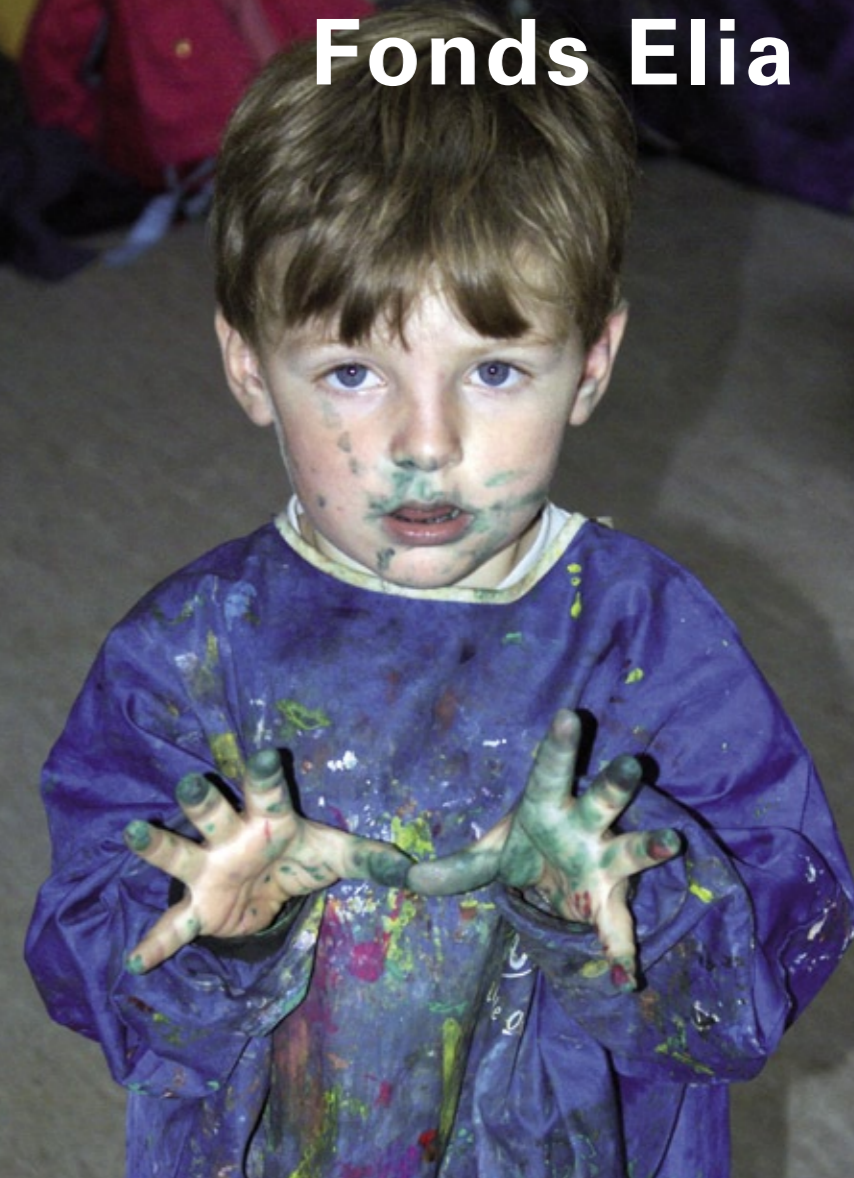
Editeur responsable: Luc Tayart de Borms, rue Bréderode 21, 1000 Bruxelles